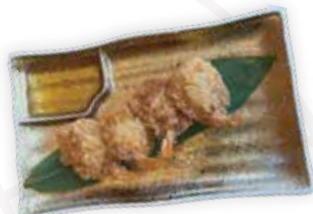
113 GAMBERI IN FARFALLA Gamberi in tempura serviti con salsa agrodolce alle prugne ALLERGENI 1-4-11 5,00 €