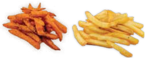
06 PATATINE FRITTE ALLERGENI 1 5,00 €