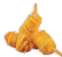
09 GAMBERI AVVOLTI IN FILO DI PATATE (3 PEZZI) ALLERGENI 1-4 5,00 €