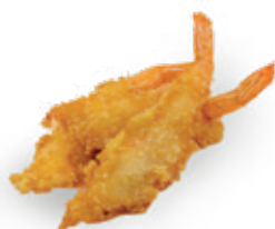
08 KUNG TOD Gamberi in tempura (3 pezzi) ALLERGENI 1-4 5,00 €