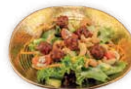
10 INSALATA CON POLPETTE DI CARNE Insalata di carne macinata condita con salsa Thai, anacardi, avocado e carote ALLERGENI 9 7,00 €