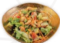
11 INSALATA CON SALSIA THAI ALLERGENI 9 5,00 €