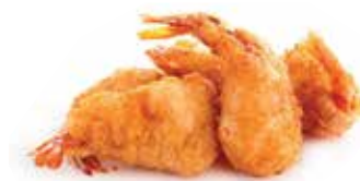
07 GAMBERI IN PASTELLA (4 Pezzi) ALLERGENI 1 6,00 €