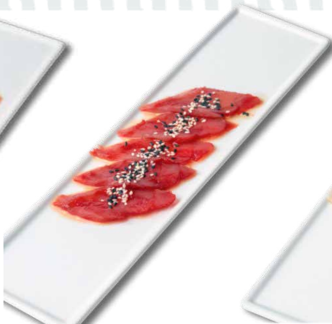
28 carpaccio di tonno