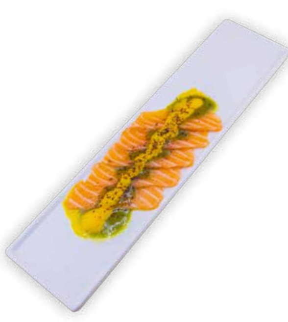
31 Carpaccio Speciale

Salmone e olio di spinaci, salsa peach mango e scaglie di cioccolato fondente, lime grattugiato