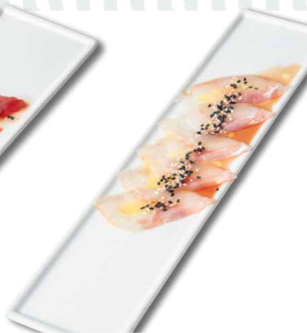
29 carpaccio pesce bianco