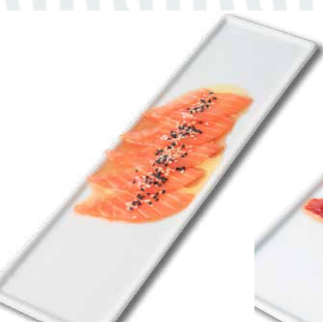
27 carpaccio di salmone