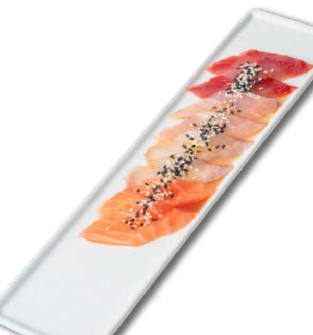
30 carpaccio misto